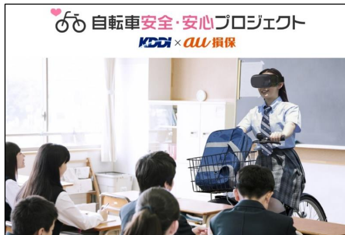
<VR 授業キットを活用した授業イメージ>

本プロジェクトでは、自転車乗用中の交通事故が多い高校生に対し（注1）、社会課題となっている自転車ながらスマホを防ぐ方法を考えることを目的として、「自転車ながらスマホを防ぐ VR 授業キット」（以下 VR 授業キット）を制作しました。